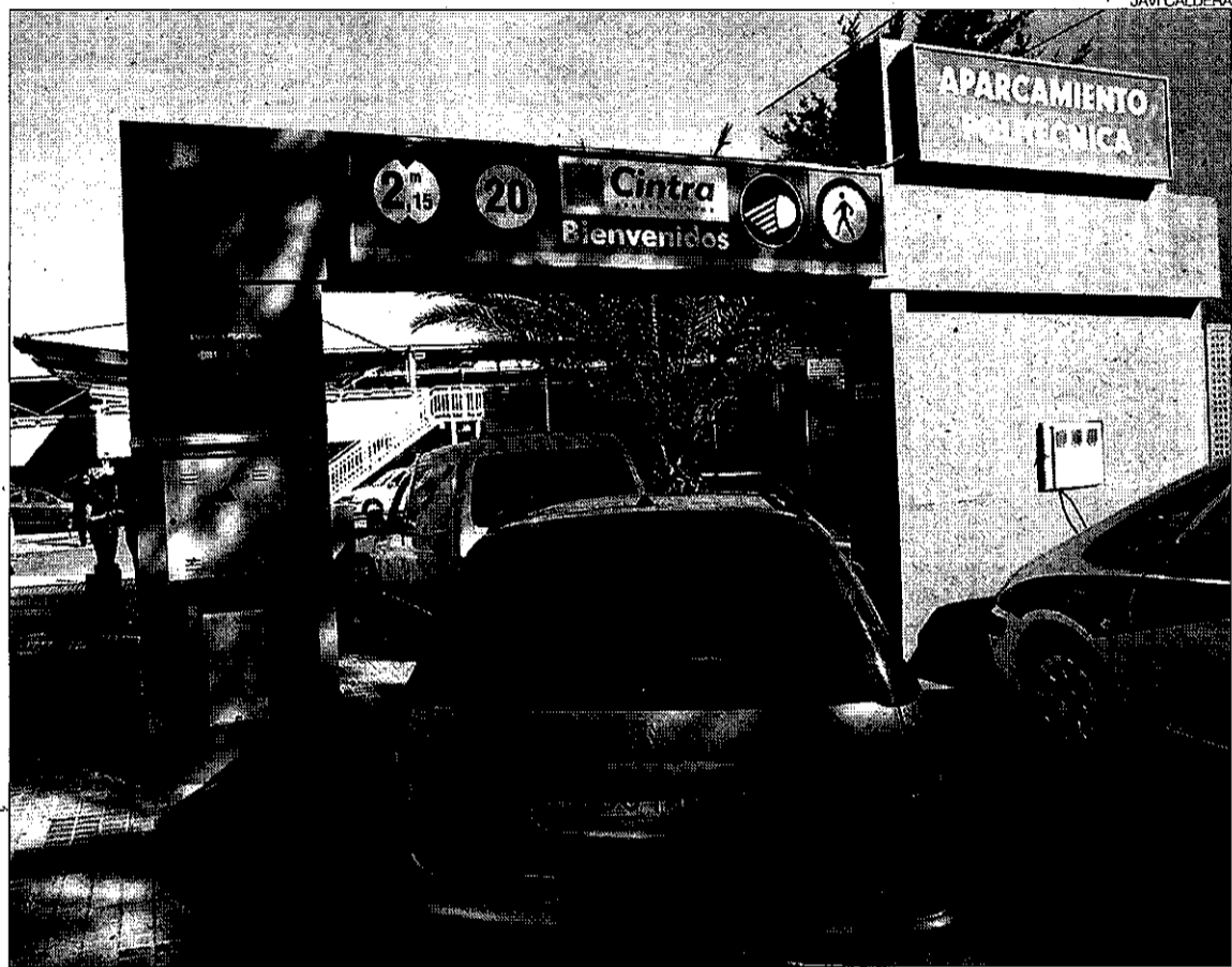
► Dos vehículos se detienen delante de la barrera del aparcamiento de la Politécnica.

La empresa presume de haber construido el aparcamiento más sostenible de toda España, puesto que es rápidamente desmontable, no ha necesitado grandes obras urbanísticas ni excavaciones, y consume muy poca energía, ya que al estar al aire libre no requiere de sistemas para la extracción de humos ni para el alumbrado durante el día. Además, en la planta superior se colocarán placas solares sobre la